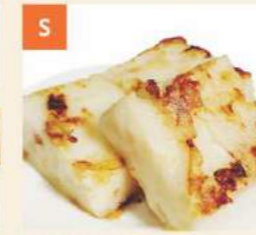
S Bột Chiên Củ Cải Pan Fried Turnip Cakes 蘿蔔糕