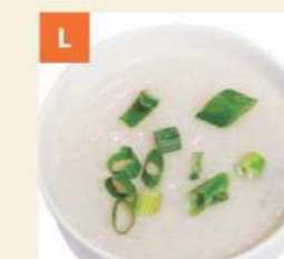
L Cháo Thịt Trứng Bách Thảo Century Egg & Pork Congee 皮蛋瘦肉粥