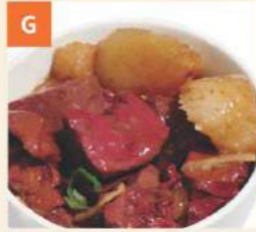
Huyết Heo Nấu Củ Cải Pig's Blood Jelly w Turnip 蘿蔔豬紅