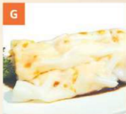
Bánh Cuốn Tôm Steamed Rice Noodles w Prawn 鮮蝦腸粉