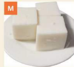
M Bánh Nước Dừa Coconut Pudding 椰汁糕