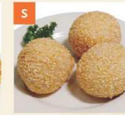
S Bánh Chiên Nhân Đậu Đỏ Deep Fried Sesame Balls w Red Bean Paste 煎堆仔(豆沙)