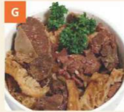
Bò Thập Cẩm Nấu Củ Cải Mixed Beef Tripe with Turnip 蘿蔔牛雜