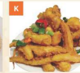
K Râu Mực Chiên Giòn Deep Fried Squid Tentacles 炸魷魚鬚