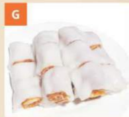
Bánh Cuốn Dầu Cha Quẩy Steamed Rice Noodles w Dough Fitters 炸兩