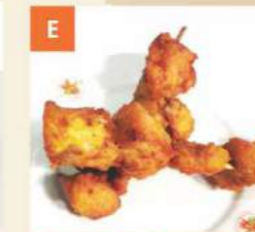
E Gà Xiên Sa Tế Satay Chicken Skewers 沙嗲雞串