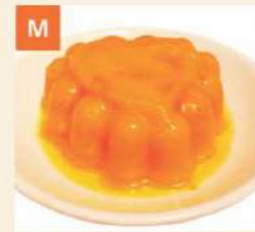
M Bánh Soài Mango Pudding 芒果布丁