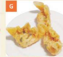
G Bánh Xếp Tôm Chiên Deep Fried Prawn Dumplings 炸蝦角