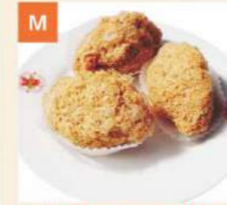
M Bánh Chiên Khoai Môn Deep Fried Taro Dumplings 芋角