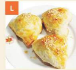
L Bánh Nướng Xá Xíu BBQ Pork Pastries 叉燒酥