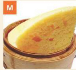
Bánh Hấp Mã Lai Steamed Sponge Cake 馬拉糕