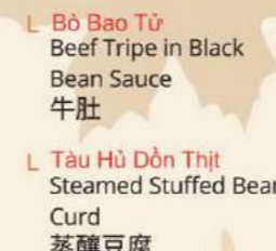
Bò Bao Tử Beef Tripe in Black Bean Sauce 牛肚