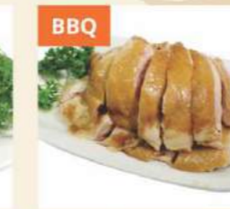
BBQ Gà Xi Dầu Soy Sauce Chicken 豉油雞