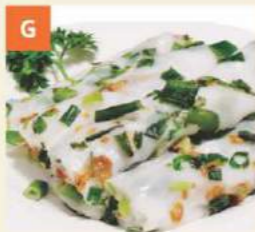
Bánh Cuốn Tôm Khô Hành Steamed Rice Noodles w Shallots & Dried Shrimps 蔥花蝦米腸