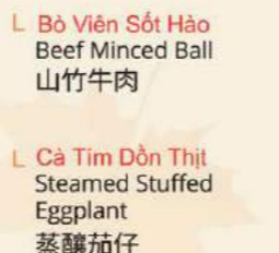
Bò Viên Sốt Hào Beef Minced Ball 山竹牛肉