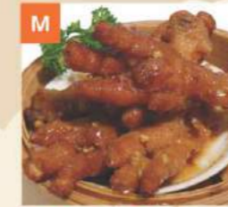
Chân Gà Sốt Tàu Xi Chicken Feet in Black Bean Sauce 鳳爪