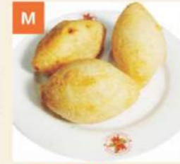
M Bánh Chiên Mặn Deep Fried Combination Dumplings 鹹水角