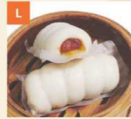
Bánh Lạp Xưởng Chinese Sausage Rolls 臘腸卷