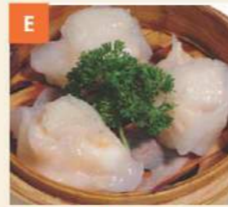
Bánh Xếp Sò Điệp Scallop Dumplings 帶子餃