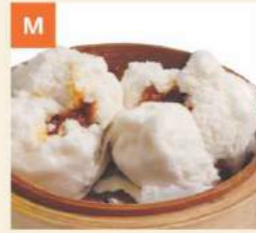
Bánh Bao Xá Xiu BBQ Pork Buns 叉燒飽