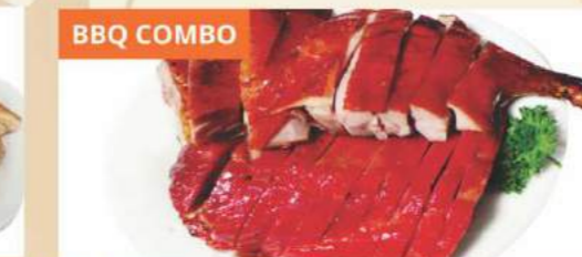
BBQ COMBO Thịt Quay 2 Món BBQ Plate Combo (Select Any Two From Above) 燒味雙拼 (以上任選兩種)