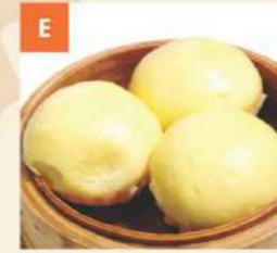
Bánh Bao Sữa Trứng Muối Salty Egg Custard Buns 金黃流沙包