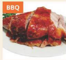
BBQ Vịt Quay Roast Duck 燒鴨