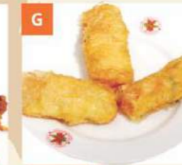
G Tàu Hủ Kỳ Cuốn Prawn Bean Curd Rolls 腐皮蝦條