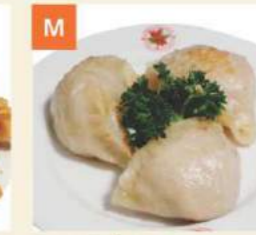
M Bánh Xếp Chiên Pan Fried Pork Dumplings 煎鍋貼