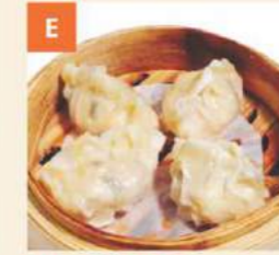
Bánh Xếp Vĩ Cá Shark Fin Dumplings 魚翅餃