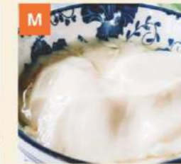
M M Tàu Hủ Nước Đường Sweet Bean Curd Pudding 豆腐花