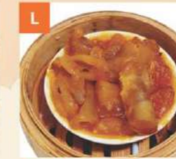
Gân Bò Beef Tendon 牛筋