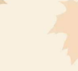
Cà Tim Dồn Thịt Steamed Stuffed Eggplant 蒸釀茄子