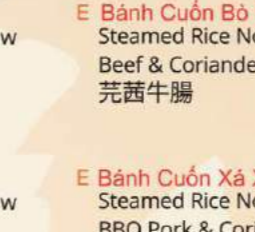
Bánh Cuốn Bò Ngò Thơm Steamed Rice Noodles w Beef & Coriander 芫茜牛腸