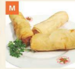
M Chả Giò Spring Rolls 春卷