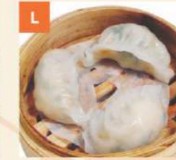
Bánh Xếp Lá Hẹ Garlic Chives Dumplings 蒸韭菜餃