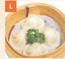
Bánh Xếp Thượng Hải Shanghai Pork Dumplings 小籠包