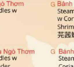
Bánh Cuốn Tôm Khô Ngò Thơm Steamed Rice Noodles w Coriander & Dried Shrimps 芫茜蝦米腸