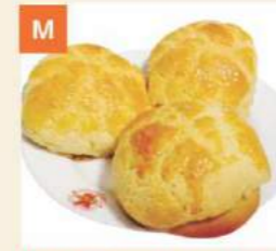
M Bánh Nướng Nhân Sữa Baked Custard Buns 奶皇菠蘿包