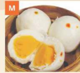
Bánh Bao Sữa Steamed Custard Buns 奶皇包