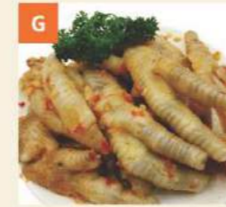
G Chân Gà Kiểu Thái Thai Style Spice Chicken Feet 泰汁鳳爪