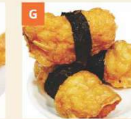
G Tôm Cuốn Chiên Deep Fried Prawn & Seaweed Rolls 紫菜蝦條