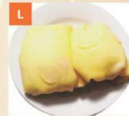
L Bánh Gỏi Soài Mango Pancake 芒果班戟