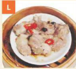
Sườn Sốt Tàu Xi Pork Ribs in Black Bean Sauce 豉汁排骨