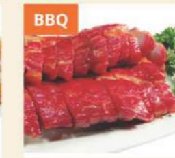
BBQ Xá Xíu BBQ Pork 叉燒