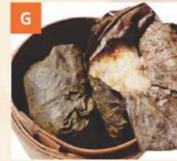
Bánh Nếp Gà Sticky Rice with Chicken 糯米雞