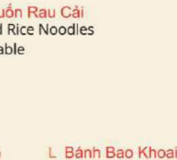
Chay La Hán Vegetable Steamed Rice Noodles 羅漢齋腸粉