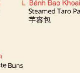
Bánh Bao Khoai Môn Steamed Taro Paste Buns 芋蓉包