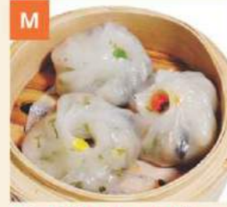
Bánh Xếp Chay La Hán Steamed Vegetarian Dumplings 羅漢齋餃