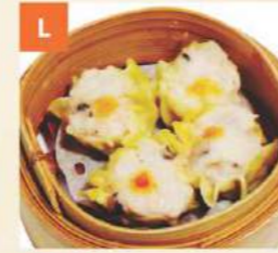
Xiu Mai Steamed Prawn & Pork Siu Mai 燒賣