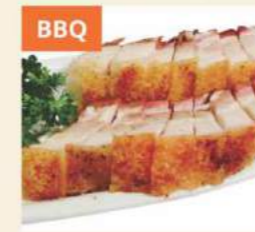
BBQ Thịt Quay Roast Pork 燒肉