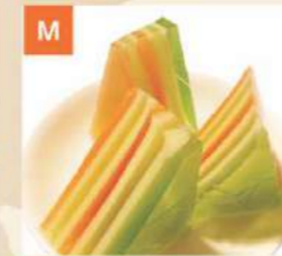
M Bánh Da Lợn Màu Rainbow Jelly 彩色果凍