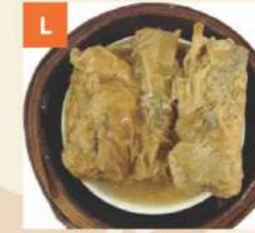
Tàu Hủ Kỳ Cuốn Tôm Thịt Bean Curd Rolls with Prawn & Pork 鮮竹卷