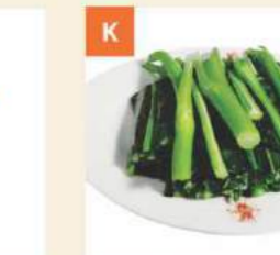
K Rau Cải Sốt Hào Chinese Broccoli Topped with Oyster Sauce 油菜