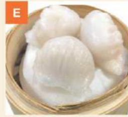
Há Cảo Prawn Dumplings 蝦餃