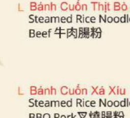
Bánh Cuốn Thịt Bò Steamed Rice Noodles w Beef 牛肉腸粉