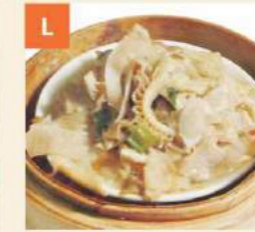
Bò Lá Lách Beef Tripe with Ginger & Shallots 牛柏葉