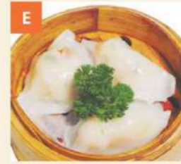
Bánh Xếp Prawn & Combination Dumplings 鮮蝦粉果