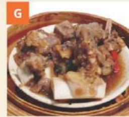
Bò Nê Tiêu Đen Beef Ribs in Black Pepper Sauce 黑椒牛仔骨